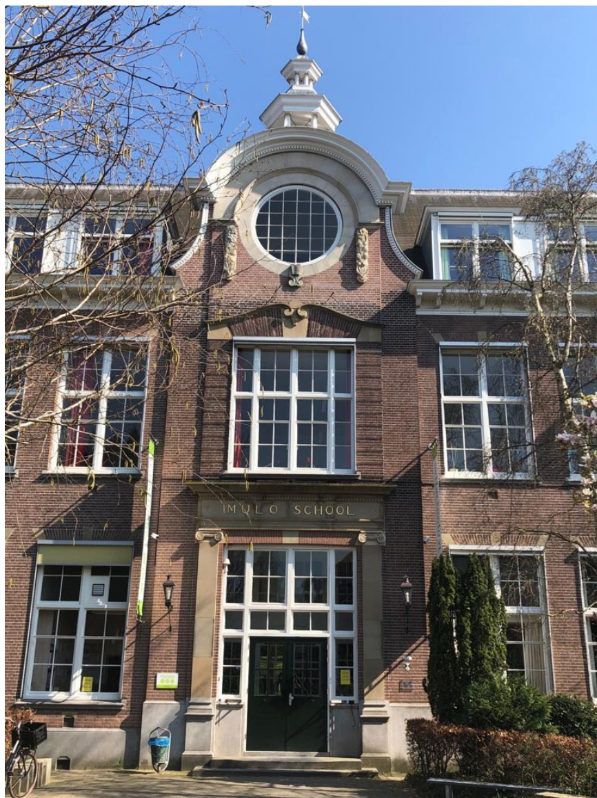
Ons schoolgebouw aan de Vijverweg 31 in Bloemendaal

Op onze site staat alle informatie over onze school: missie, visie en onderwijskundig concept, de laatste nieuwtjes en heel veel praktische informatie (bereikbaarheid, financiën, aanmelden, et cetera). Ook is er een aparte rubriek “voor groep 8”.